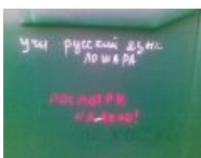
Grammar Nazi зашли посрать кирпичами