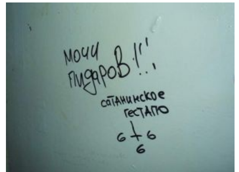
Гот мит унс!