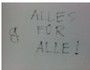
«Всё для всех»