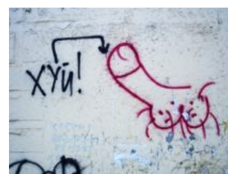
Капитан Очевидность и классика жанра

Про надписи в общественных туалетах писал ещё Гашек в предисловии к своему бессмертному Швейку. И таки да, там, где есть туалеты, графика сия будет всегда, ибо испражнение — занятие скучное, и чем серьёзнее нужда, тем больше времени уходит впустую. Почему бы не занять себя креативом ? Ввиду того, что мужчины более пассионарны , мужские уборные пестрят этим видом творчества в большей степени, чем женские . Также, ввиду специфики устройства мочеиспускательных каналов мужских особей homo-почти-сапиенс, туалетная графика украшает стены мужского туалета не только по бокам, но и на задней, за толчком, стене.