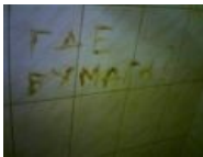
Клиенты недовольны (а-ля Tension )