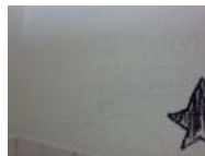
Туалет мюнхенской студенческой организации