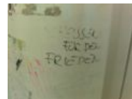
Университет Бонна. «Срите за мир»