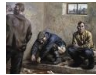
Отражение сабжа в живописи