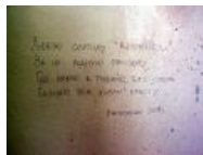
Ода Альма- матери