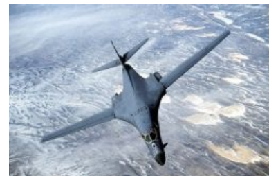
Еретично-богомерзкий пиндосский Rockwell B-1 Ланцерь (Lancer)

Дальность 12300 км и 9500 км соответственно, следовательно у нашего гораздо шире потенциальная аудитория. Правда, вот летать пиндосский может на 2 км выше (и ещё, лучше приспособлен к полётам на сверхмалых высотах), что, впрочем, «лебедю» нахуй не сдаётся, ибо В-1 — именно бомбардировщик в первоначальном смысле этого слова, и именно бомбы в основном и несёт, тогда как Ту-160 работает хтоническими Х-55 и Х-555, которые летают на 3-5 тысяч км. на предельно малой высоте, причём Х-555 способна влететь в указанное окно указанного дома и испепелить неправильную табуретку на табуретном складе. Х-55 не столь точна, но ей и не надо, ибо ядрёная. Он может и бомбануть, снеся за раз несколько десятков городов и предварительно топорно вырубив ПВО на пару часиков путём brutального подрыва в атмосфере ядрёной бомбы мегатонн этак на 20 а то и побольше . Но это - на крайний случай, если наши заокеанские друзья таки выведут из строя все МБР с помощью ПРО и обезоруживающих ударов. Вообще же его задача проще - добывать крылатыми ракетами то небольшое, что останется после экскурсии в Пендостан Сатаны, Стилета,