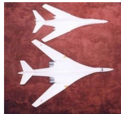
Очевидное превосходство в масштабе 1:72