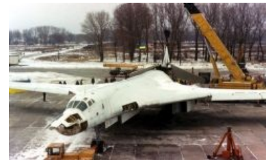
Выпиливание Ту-160 расовыми хохлами.