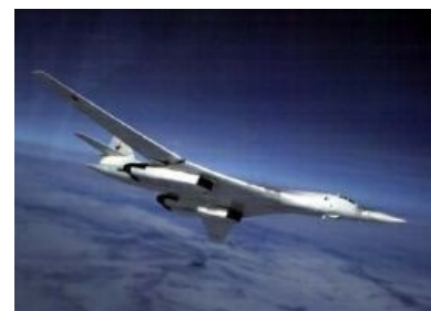
Ту-160 в верхних слоях атмосферы

В начале 70-х в СССР сложилась ситуация, когда фактически не было ни одного самолёта, который мог бы гарантированно доставить порцию атомных пиздюлей нашим западным партнёрам. Стоящие в то время (и продолжающие стоять в это) на вооружении Ту-95, конечно, могли доставить парочку, но не гарантированно. По поводу этой проблемы никто не стал особо париться, так как уже имелись в достаточном количестве самодоставляющиеся пиздюли. Но, поразмыслив над возможностью размахивания оными, за бугром пришли к выводу, что слишком это стрёмное дело, ибо кто-то, обосравшись, может не понять и уебать заранее, просто чтобы не пропустить удар. Решив, что подлодок нихрена не видно, а потому для демонстрации длины силы воли они тоже слабо подходят, выбор остановили на самолётах. Б-52 уже никаких гарантий не давал, и пиндосское руководство решило напилить что-нибудь поэпичнее. Но известие о том, что америкосы делают новый стратегический бомбардировщик, заставило тогдашнее руководство СССР высрать немало кирпичей и быстренько выделить несколько десятков тысяч сотен нефти на такой же.