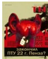
Низда Жопа с ушами