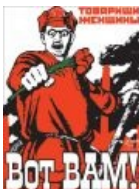
Открытка на 8 марта