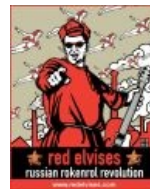
Рекламка Red Elvises