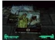
Bethesda Softworks в теме