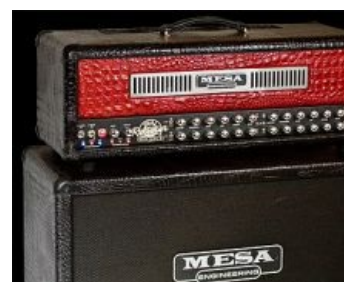
Тёплый ламповый Mesa/Boogie Road King II за 160 000 рублей. Фап-фап-фап