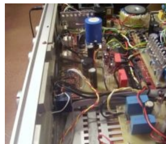
Кривая поделка радиста-самоделкина

Фокус в том, что надпись «For audio» могут поставить на любую деталь, и звук она никак не улучшит. Более того, часто так клеймят те детали, которые не проходят строгий контроль, предъявляемый к компонентам промышленного класса, то есть априори менее качественные. Возможность вдесятеро дороже продавать эти детали доверчивым звуколожцам — настоящий подарок производителям. Звуколюбы же с пеной у рта убеждают окружающих в том, что только детали «фор аудио» позволяют