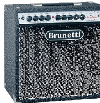
Бюджетный (≈ 1500$) ламповый комбоусилитель Brunetti Maranello

Самый факт существования дорогой техники вызывает у нищоброда жуткий баттхёрт — по той лишь причине, что он не может её купить, а вовсе не потому, что она ему необходима. Бугурт совместно с завистью толкает сабжа на довольно смешные действия, обычно — на написание разоблачительных статей, в которых подробно описывается, что тёплая ламповая техника не стоит своих денег, и что все,