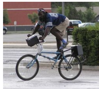
А разве что-то сломано?