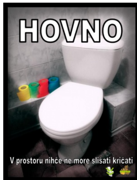
Постер к фильму «Говно» (а слоган из «Чужого»).