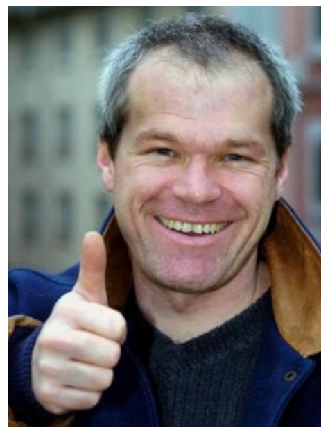
Уве Болл гарантирует.

Здесь собраны все вышедшие уеболлизации игр. Не пугайтесь.