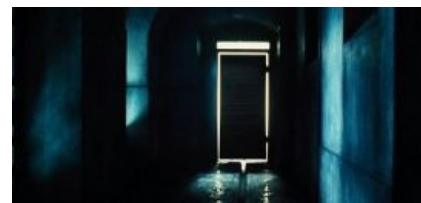
Некоторые двери лучше не открывать

Дальше — больше. Сынулька был устроен на теплое местечко в семейный бизнес, и несмотря на то, что приходил он туда только в день зарплаты, ему все равно исправно платили, родной, хуле. Абсолютно халявной и ненапряжной жизни оказалось мало, и Рональд быстро пристрастился к вещам. Что именно он употреблял, сейчас уже точно неизвестно. Вполне возможно, что