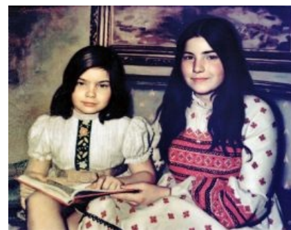
Дочери Дефео. Няшки же!