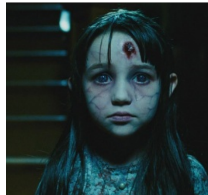
Мертвая Алисон грустно смотрит на новых жильцов