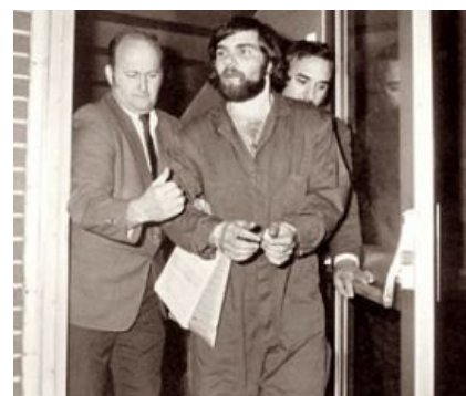
Ему 20 лет и он бородат