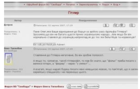
Скриншот того самого ответа

Мстители: Эра пастора - Анти трейлер [UKR] Мстители: Эра пастора - Анти трейлер Правый Сектор: Відплата - Анти трейлер [UKR] Прав Сек: Відплата - Анти трейлер Радикальный человек - Анти трейлер Радикальный человек - Анти трейлер