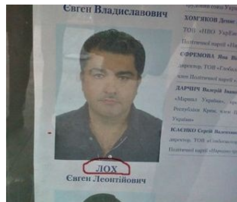
Был и такой кандидат