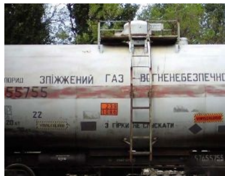
Миллионы спизженного газа.