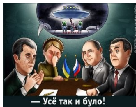
Украинская версия происходящего