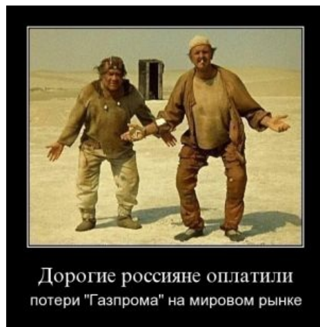
ну какбе на самом деле так