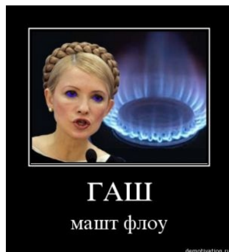
Гаш машт флоу