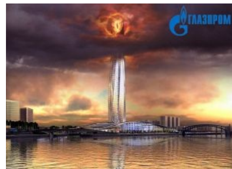
Старший младший брат следит за тобой

Дело в том, что Нафтогаз Украины состоит из двух частей. Одна из которых занимается покупкой и продажей газа по территории Украины и, соответственно, из-за низких внутренних цен, убыточна. Другая часть занимается транзитом газа в Европу и, соответственно,