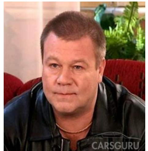
Дукалис а.к.а. Селин, уже измученный Нарзаном

Демонический Танец Дукалиса(Full) Демонический танец Дукалиса