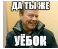
Да ты ж уёбок!