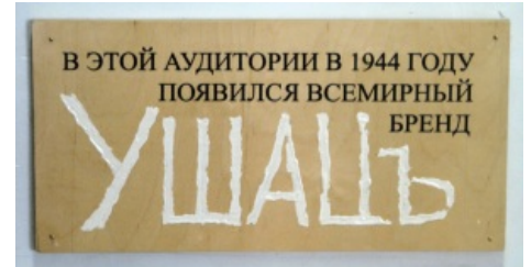
Мемориальная табличка в МАРХИ

Потом это имя стали писать на стенах института — уже в протестном значении, в пику