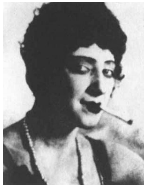
Сабж смотрит на тебя как на пионэра

Фаина Георгиевна не слишком отличалась красотой, да и пай-девочкой никогда не была, потому с мужчинами у неё никак не складывалось. По легенде от неё самой, всё началось с того, что молодой человек, от которого она фанатела, однажды спросил её: «А ты будешь дома вечером?», — после чего та побежала краситься-наманюкириваться, накрывать на стол, а в итоге товарищ пришел к ней со своей тётей, да ещё и попросил хозяйку погулять где-нибудь пару часов. С тех пор так и повелось.