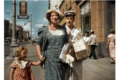
Муля смотрит на Лялю и нервнрует