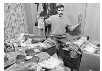
Типичный обыск дома у типичного фарцовщика