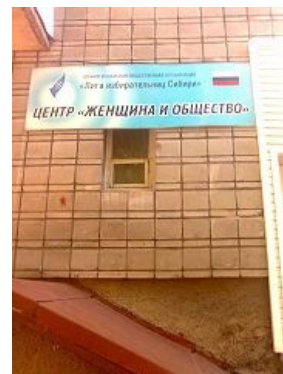
Лига избирательниц Сибири из вконтакта

В православии, как ни странно , на богословском уровне признаётся идея равноправия между мужчинами и женщинами [1], но на бытовом уровне , это мало кого заботит . Скорее всего, причина подобного парадокса, кроется не столько в самом православии, сколько в особенностях русского менталитета . В той же Греции, которая более православна , в отличии от Этой Страны , не припоминается книг, наподобие «Домостроя». Примечателен пример византийской императрицы Феодоры, канонизированной в лике святых, а именно ситуация, когда персидский царь Хосров зачитал письмо Феодоры своему вельможе Завергану со следующей фразой: « За это я обещаю тебе многие блага со стороны моего мужа, который