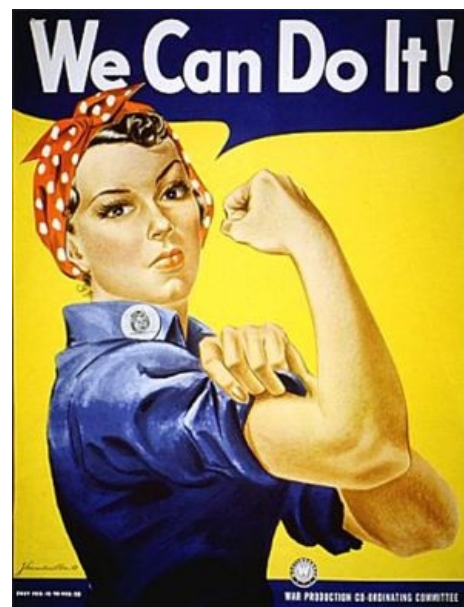
А вот хуй тебе похотливый кобель!! [2]