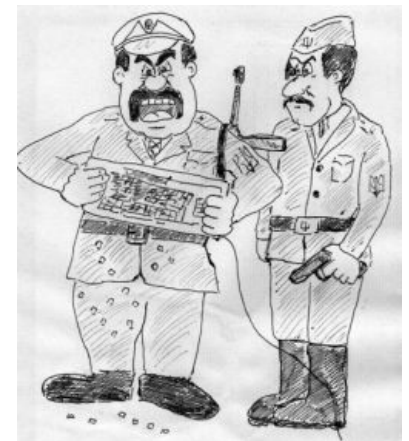
Жыдобандеровцы вырывают исконнорусские клавиши с клавиатур исконников! Рисунок потерпевшего. ІЗІЖБК