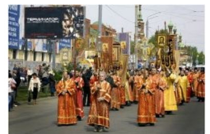
Nothing can stop phophuddiah!

Кроме самой фофудьи известность приобрели также: