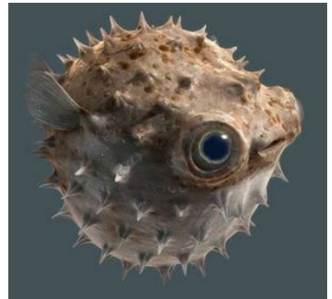
Надутенькая рыба такая надутенькая.

Большинство умерших от фугу умерли именно потому, что потребовали (за очень отдельные деньги )