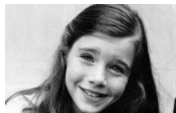
Какая няшка! Не воюйте, люди, больше!

Сначала ей никто не ответил. Тогда она написала второе письмо советскому послу. И вот через месяц Саманту вызвали к директору школы, который сказал ей: «Иди домой. Тебе пришло письмо. От мистера Андропова». Трудно описать, что творилось в душе девочки, но представить всё-таки можно. Ответ Андропова: