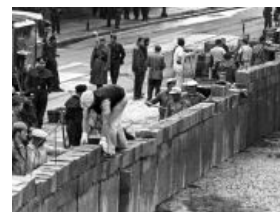
Немецкие рабочие строят железный занавес

Юридическая мякотка в том, что размещение ракет на Кубе, как и в Турции, не нарушает никаких норм международного права. Понятно, что в случае карибского острова пендосам это неприятно, но, как ни