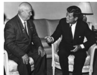
Big Boss'ы обсуждают судьбу мира

А для наглядности кубинские/советские ПВОшники сбили пиндосский самолёт-шпион, как бы намекая... Янки обиделись: ну он же просто фотографировал! И в ответ едва не утопили русскую подводную лодку, шедшую к берегам Кубы, пытаясь прорвать блокаду (незаконную, таки да). Мякотка в том, что на подлодке находились ядрёны морковки, и капитан имел приказ применять их в случае, если подвергнется нападению. На подлодной водке имела место вовсе жуткая ситуация, когда по причине отсутствия связи с командованием и наличия признаков глубоководной бомбардировки двое из трех уполномоченных членов экипажа проголосовали ЗА начало ядерной атаки на США. Но по инструкции требовалось согласие всех трех.