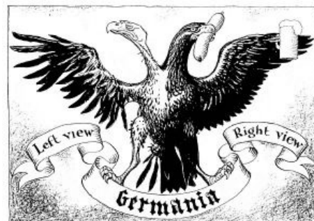
А так над немцам шутили их союзники

А их дети ломают ставшую символом сабжа Берлинскую стену