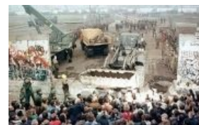
А их дети ломают ставшую символом сабжа Берлинскую стену

Немецкие рабочие строят железный занавес