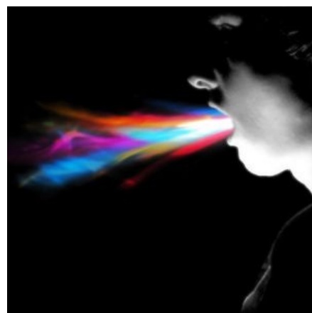
Как они себя видят

Эта фотка могла быть сделана где угодно: в тоталитарной секте, на трансперсональном тренинге или на расстановках по Хеллингеру, последнее — наиболее вероятно.