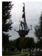
Знаменитый « Шашлык »