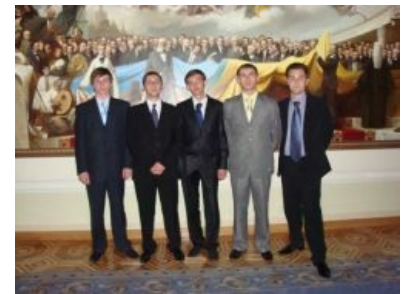
Яркий пример коллективного ЧСВ

ЧСВ и самооценка (пинд. self-esteem ) — понятия родственные, но не тождественные. Самооценка — ценность, которая приписывается индивиду себе или отдельным своим качествам. Любопытно, что в этих их США высокая самооценка люто, бешено форсится в неокрепшие мозги как минимум с младшего школьного возраста. Более того, существуют нормативы и тесты, так что пиндосская школотка, уличенная в заниженной самооценке, рискует подвергнуться принудительным занятиям с психологом. Противоположное явление — завышенная самооценка (даже сам термин неканоничен) проблемой не считается (разве что у христиан , но и им чаще всего похуй), чем больше — тем лучше, пока это не