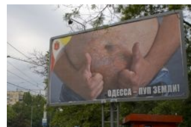
Сферическое ЧСВ в городском масштабе