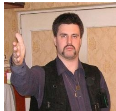
У Мицгола ЧСВ — больше 9000.

«Кто доволен самим собою, тот не может прославиться. Кто хвастается, тот не может иметь заслуги. Кто горд, тот не может возвыситься. »