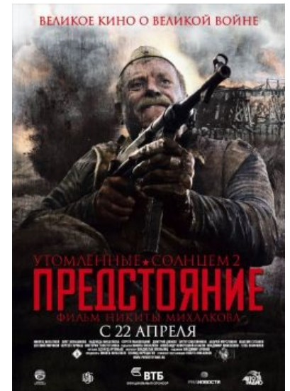
Великое кино о великом мне