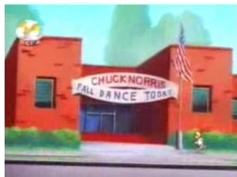
Еще про Чака