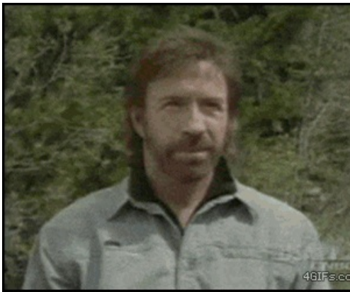
Бывает и так