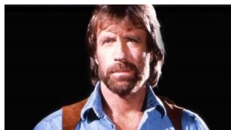
Единственная дошедшая до нас фотография Чака Норриса в кобуре