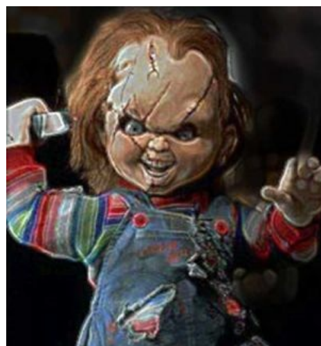
Кукла Чака. Первым УЧННР Чак Норрис расплыл её на атомы, а вторым сшил обратно