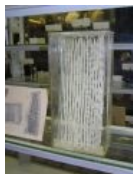
Longworm is looooooong!