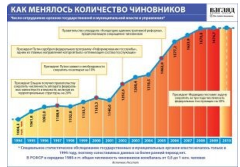
Наглядная борьба с чиновниками

За последние годы своей деятельности приходится очень плотно общаться с органами местного самоуправления.