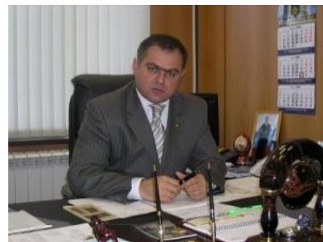
Типичный чиновник смотрит на тебя как на посетителя .

«Чиновниками» их называют скорее из-за нежелания людей разбираться в сортах говна. Никаких чинов у них обычно нет, так как на самом деле они всего лишь госслужащие . Те, кто прокачиваются до чиновника, сидят этажом выше, в отдельном кабинете и среднему человеку видны только по телевизору, во втором ряду кого/чего-нибудь официального. Именно они проводят Его Государеву волю, принимают какие-то решения, а заодно получают взятки и наслаждаются казнокрадством. Рядовые же госслужащие, то бишь простые клерки, решений не принимают и поэтому взятки по собственной инициативе не получают — максимум