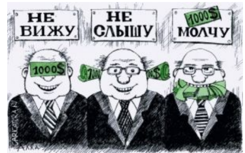
Пока один орёт, что не хватает денег, их хватает кто-то другой.