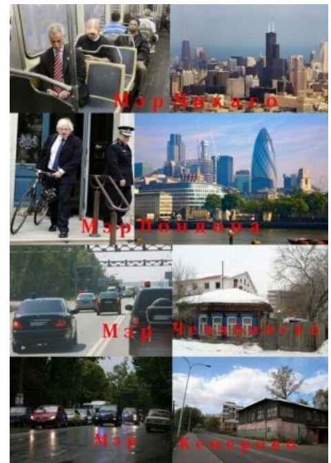
Мэр — квинтэссенция чиновника. Наглядное сравнение