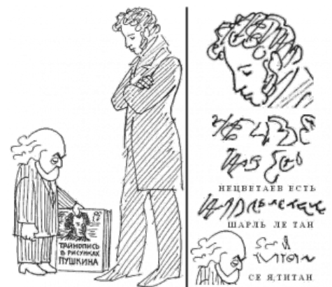
«Расшифровка» Чудиновым карикатуры Л. Нецветова

«И, наконец, самое смешное: Нецветов накрутил на голове Пушкина столько завитушек, что из них вполне можно составить фразу НЕЦВЕТАЕВ ЕСТЬ ШАРЛЬ ЛЕ ТАН (то есть, ШАРЛАТАН), тогда как из знаков моей головы - фразу СЕ Я, ТИТАН . Так что кто над кем смеётся?»