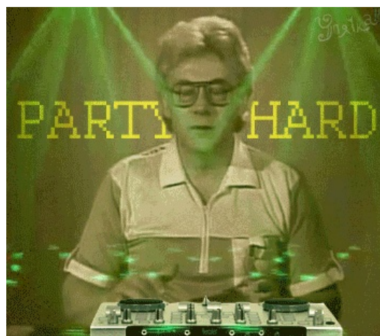
Party Hard, уячкоёбская версия

И еще как идет! Когда в конце восьмидесятых Кашпировский и Чумак действительно ведь усыпляли многих, болячки у некоторых и вправду заживляли, заряжали воду и т. п. — к этому быстро привыкли, миллионы людей ощутили эффект на себе, и никто уже особенно не удивлялся. Врачи в основном не верили и ругались, многие после передач обращались к ним с явным ухудшением здоровья, — но ведь это тоже эффект, отрицательный, но наиболее достоверный: его традиционная массовая медицина фиксировала. И не только гипноз, не только внушение: а тот америкашка, который по телевизору зрителям вставшие часы