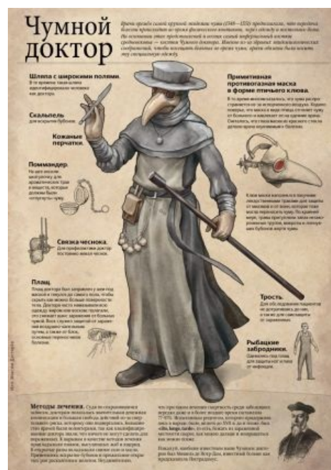
Такой вот типаж