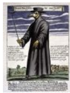
Главное, чтобы костюмчик сидел...