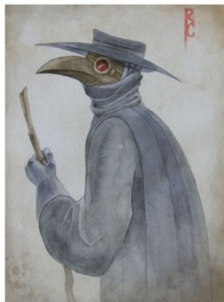
На что жалуемся?