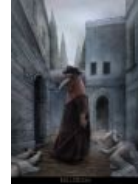
Ему так похуй