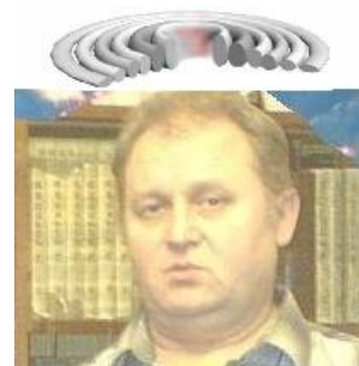
Отец-создатель с электронным нимбом. Автопортрет.