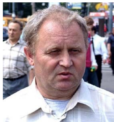
Сферический гений в гукууме