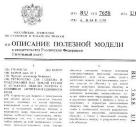
Описание полезной модели.

Средь нас был юный талибанщик Неверных он бил впереди За дело фундаментализма, С огнем Бен Ладена в груди!