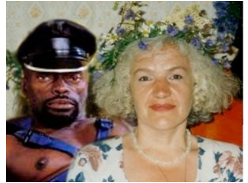
Извра-Тина и ее новый деревянный дильдо. Они смотрят на тебя, как на Пусю.