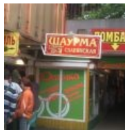
Шаурма «Славянская» у Паши