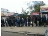
Легендарная очередь за легендарной нижегородской шаурмой