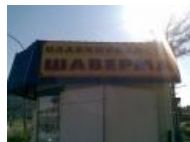
И не у Паши