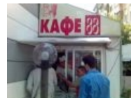
Шаурма в «Кафе 88»