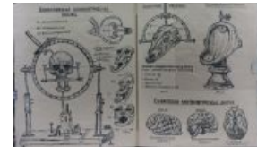
Прогрессивный метод диагностики

Наглядное пособие: «Как поймать шизофреника»