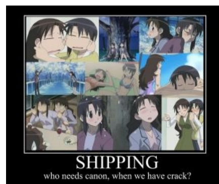
Зачем канон, если есть крэк?