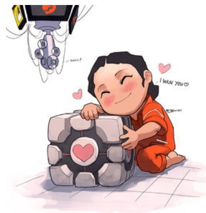
Челл с кубом — всё по канону.

Поскольку здравый смысл и логика используются мозгом шиппера в последнюю очередь, то на просторах интернетов появляются такие экзотические варианты пейринга, которые в голове у здорового человека не возникли бы никогда. Вот несколько простых правил, по которым может быть выбрана пара. Хотя правилами их назвать сложно, потому что состоят они целиком из взаимоисключающих параграфов . Итак, два персонажа могут быть парой если они: