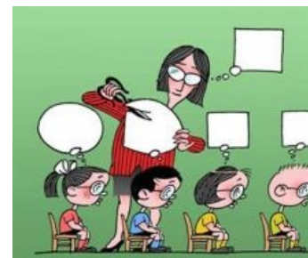
Способ изготовления винтиков СИСТЕМЫ в начальном звене...