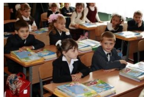
Школота, начальное звено.