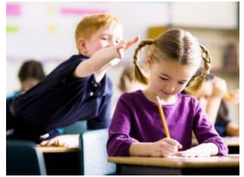
В личинке жлоба просыпается самец