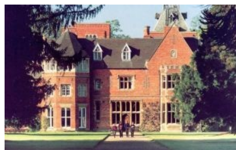
Biton Grange School

Большинство типичных британцев начинает учиться в школе с 4-5 лет, к 11 годам переходит в среднее звено (пруф — в Гарри Поттере ) и в 16 лет успешно заканчивает 11 классов, что в их стране является средним (основным) образованием, обязательным для всех. Далее школьник или остается на двухгодичные курсы подготовки к вузу в школе, или пиздует в колледж. Причём в старшей школе вместо образования широкого профиля предлагают всего 4-5 (на следующем курсе всего 3-4) предмета на выбор из огромного списка, ничего не напоминает?