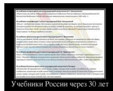
Школьные учебники недалёкого будущего

В 2011 году чиновники решили, что школьникам мало двух уроков физкультуры в неделю, и ввели третий. Это обрадовало и учителей (надо менять расписание уроков, да и проводить урок надо не с одним-двумя классами, а с двумя-тремя-четырьмя, и попробуй организуй соревнование или ещё какую-нибудь поебень), и школьников (сидеть в тюрьме на час больше, хер переоденешься на физру). И если раньше на физкультуре тупо бегал весь класс, то теперь пол-класса сидит на скамейках, а другая половина бежит — спортзалов то не прибавили, и количество квадратов на человека почему-то не увеличилось. Описывать, ЧТО творится в раздевалке, рассчитанной на 10-15 человек, до и после урока не надо — всё и так понятно. Ибо в правительстве хотели как во всех цивилизованных америках и европах, а получилось как всегда . Алсо, именно третьей физкультуре одиннадцатиклассники обязаны своими 37 часами и семью уроками. И это не может не вызывать butthurt . Также это вызвало такое ужасное явление, как теоретическая физкультура. Чаще представляет собой странное мероприятие, где все ученики либо страдают хуйней, либо делают абсолютно бессмысленные действия. Выглядит это, как изучение езды на велосипеде без, собственно, езды. Ну, или как служба в ВВС без (хотя бы) наблюдения самолетов.