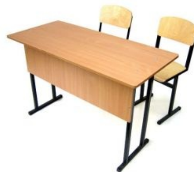
Хорошая, годная парта и её друзья