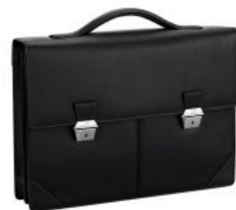
Хороший, годный вариант портфеля

Люто ненавидимый 99% школьников тип издевательства. Введена