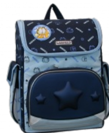
Самый попсовый вид. Вмещает больше, но сосёт в дизайне