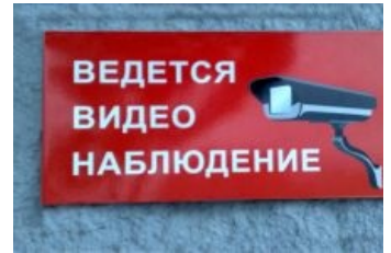
За тобой следят в монитор. Иногда

Принцип работы этого комплекса таков: товар маркируется специальной защитной этикеткой, либо жёстким датчиком, на выходе устанавливаются ворота, которые пищат при выносе неоплаченного товара и созывают на подмогу дегенератов-прокрастинаторов из отдела охраны.