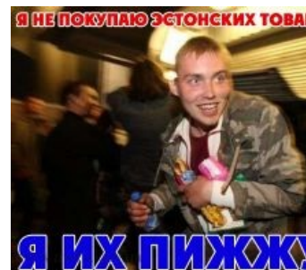
...и его понятия