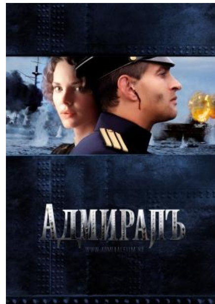
АДМИРАПЪ такой АДМИРАПЪ

Алсо, ерь голямъ — вполнѣ обычная буква, произносится какъ ъ в словѣ «България».