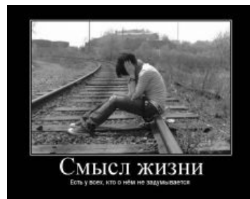
На самом деле

The Young Dads - Existential Crisis Песня