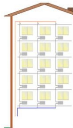
Вертикальная схема отопления