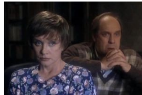
Вера Алентова смотрит, как ебут в жопу Марию Шнайдер.