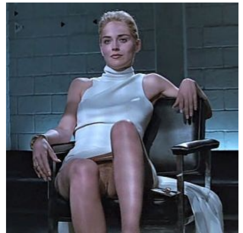
Ради этого и смотрели полфильма.