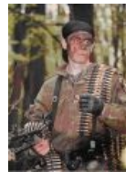
Суров и крут