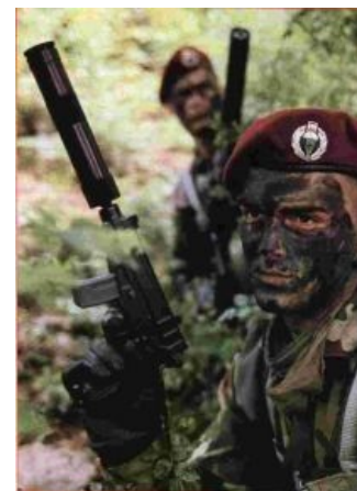
Югославский спецназ в засаде