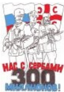
Нас 300 миллионов