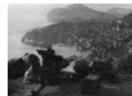
Half-Life 2: Lost Coast