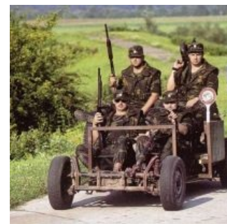
Боевая машина смерти