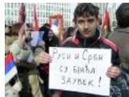
А чем ты помог своим братьям?