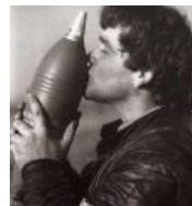
Поцелуи с миной на удачу