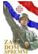
Хорватский ариец: «За дом готов make you unsee it »