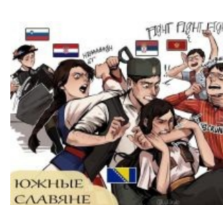
Суть статьи одной картинкой

Получив независимость, хорваты внезапно из мирных социалистических