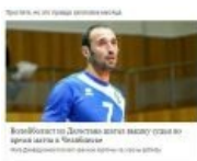
Когда рядом нет труба