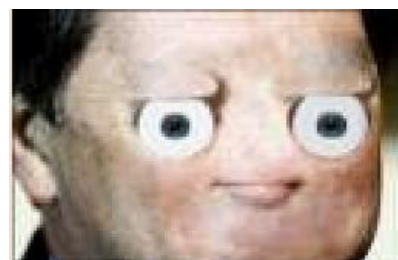
Смотрите, да это же т т

т — буква из письменности дравидского языка каннада, никому, кроме 50 миллионов индусов, не известного. Читается «ттха». Японский анонимус с 2channel, копаясь в дебрях юникода, нашёл эту букву и начал использовать форсить единственным известным ему образом — как смайлик. Оттуда и пошло.