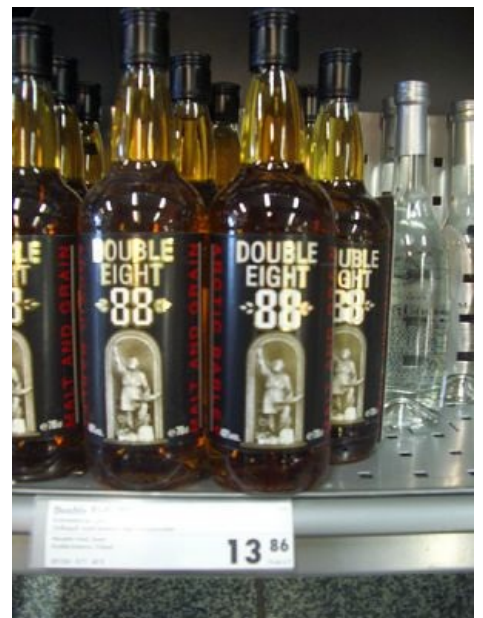
Расово верная водка за 14 евро (без 14 центов). (Обратите внимание на правую руку чувака на этикетке!)