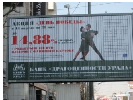
Пример использования в оформлении билбордов.