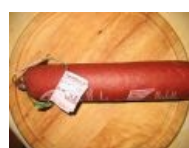
Львівська колбаса Капча