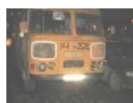
Автобус № 2