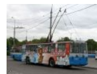
В парадной форме