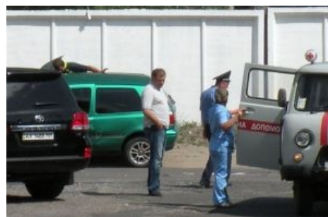
Михаил Добкин и его Land Cruiser с номерным знаком АХ 1488 ММ

«14 — это число сакральное для меня с раннего детства. Почему — сказать, естественно, нельзя, такие вещи не могут быть объяснены.»