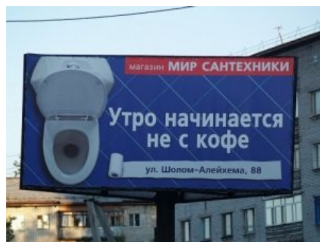
Еще один билборд (обратите внимание на адрес на туалетной бумаге, а в названии улицы ровно 14 символов). Кстати, это Биробиджан .