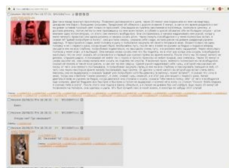
Как администрация 2ch.hk зарабатывает деньги