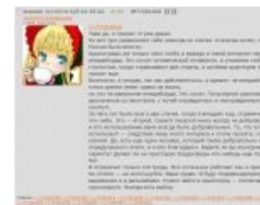
Нотариально заверенный скриншот

11 октября 2014 — хохол Степан-шинкуфаг, преданный три года назад обезьяной, решил отомстить и встроил в куклоскрипт автоскрытие крымотредов по нескольким ключевым словам. В ответ на это обезьяна подсветила все посты с куклоскрипта красненьким , а потом заблокировала куклу по всей борде. Позже было разрешено пользоваться скриптом в тематике, блокировка распространяется только на /b/.