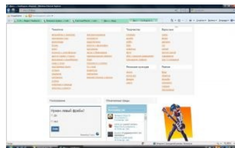
Новая стартовая страничка с марта