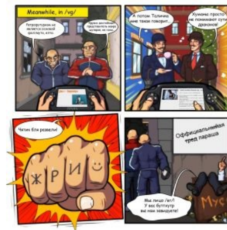
Краткая суть событий в /vg/

10 октября 2012 — сомалийский фильтр засуспендил домен 2ch.so по неизвестной причине. Пока основные адреса 2-ch.so и 2-ch.ru.