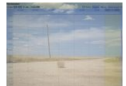
Скриншот расписания эфиров

Направление радио — виабу . Несмотря на это, часто проводятся тематические эфиры посвящённые чему только угодно, и не относящиеся к Японии чуть более, чем полностью. Чаще всего доставляют. Аудитория редко превышает 10-15 человек, в силу того, что диджеи, да и сам Соус-кун, уже давно забросили попытки пиара на различных бордах. Ссылка на радио висит в заголовке списка досок Ичана, но эфиры там ни кто уже давно не объявляет. От части по тому, что завсегдатаи уютенького чатика боятся наплыва рака [2] .