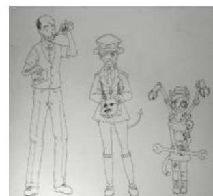
Маскоты работы Мангаки-кун.

После того, как к обсуждению подключились участники eroge_project и Мангака-кун, было сгенерировано небольшое количество качественного арта на тему. Тем не менее, деятельность по описанию сеттинга и персонажей автобуса в /b/ угасла так же внезапно, как и началась, и тема маскотов авто/б/уса не получила логичного завершения [3] .