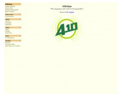
Скриншот заглавной страницы Авто/b/уса

410chan.org ( Чио-чан, Автобус-чан ) — анонимный имиджборд , созданный Соус-куном с целью несения добра и позитива (в иичановском его понимании) в массы анончиков. В данный момент 410chan состоит из 12 разделов, включая такие специфические, как раздел о цундере . Одно из своих названий — Автобус-чан — получил из-за того, что местный /b/ называется не иначе как Авто/b/ус. Является запасным аэродромом на случай выпила Ычана для обитателей последнего.