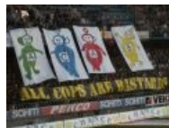
Телепузики как бы намекают...