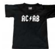
Для любителей AC/DC