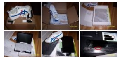
ASUS Eee PC 1000NE и культовые Onitsuka Tiger Mexico 66