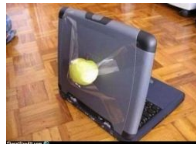
Пример ребрендинга, но не с Асусом

Не путать с мемом « тракторист » (видео с коим выше).