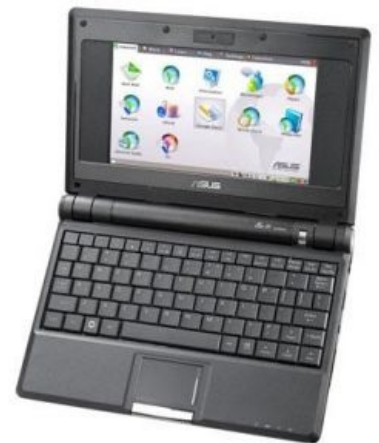
Прямоугольный ASUS Eee PC 701 в вакууме

А в 2007 году некая международная организация решила начать компьютеризацию нищей Африки . Мешало лишь одно: чуть менее, чем все жители этого континента не в состоянии не то что купить компьютер, а даже пожать нормально. Выход был найден: выпускать нотики по себестоимости около 100 вечнозеленых рублей и раздавать их каждому негритенку бесплатно (One Laptop Per Child — OLPC). Для этого консорциум фирм начал проект ClassmatePC/OLPC. А пока они думали, на какой элементной базе собирать эту игрушку (ведь в группе были Intel и AMD одновременно, да и VIA свои процы хотела приткнуть, а кое-кто был вообще за ARM-ядро), хитрые барыги компании Asus, вдохновленные идеей большого профита от продажи огромного количества недоноутбуков, идущих по цене немногим большей доширака , решили выкинуть из ноутбука, по их мнению, громоздкий и редкоиспользуемый хлам, такой как сидюк и винт, зато укомплектовали добротным калькуляторным процессором.