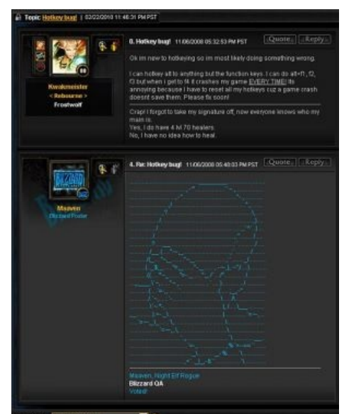
Незамутнённые эльфы 80 уровня печалят персонал Близзард