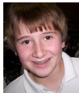
An Hero never forget.

«Самоубийцы делают благое дело — они избавляют мир от самих себя »