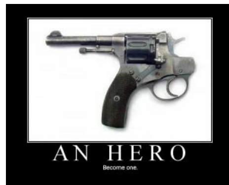
Помощь в решении любых вопросов!