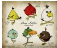
Глазами Карла Линнея