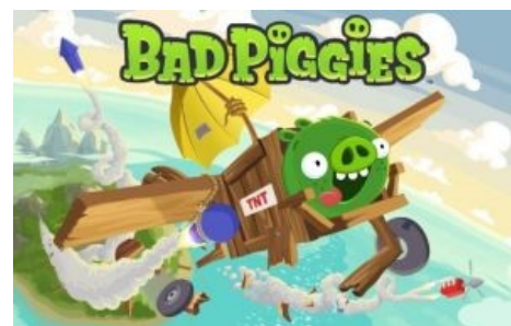
Свиньям рогатки не нужны

Первый спин-офф. Как оказалось, свиньи — прирождённые технари и гении инженерной мысли . Разработчики не прогадали и создали совершенно на птиц не похожую головоломку, при этом упорную вдвойне. Пролог игры несложен: трое свиней — толстый король, опытный механик и юный балбес охотятся за птичьими яйцами. Но малолетний раздолбай все время умудряется испортить любое дело: вбрасывает карту в вентилятор , находит монтажку и стучит ею по ящику с динамитом. Разгрести устроенную заваруху и находить разбросанные повсюду куски карты поручают юному неразумному свинождеаю. Теперь вместо спинно-мозговых бросков и задрочивания уровней на 3 звезды нужно включить моск, таки да.