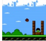
Версия для Dendy.