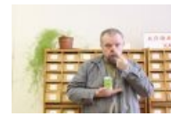
Пахом в теме