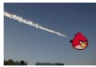
Суровая уральская версия