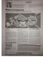
Привет от Сноудена