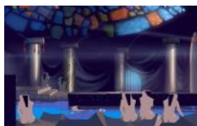
Эротика образца 91 года

срежиссированное, как в современных играх — запнулся=умер) и многое, многое другое. Основным видом было привычное 2D, но периодически герой полз, садился в кабину инопланетного танка, плыл и т. п. Иногда он огребал пиздюлей, терял оружие, оставался без патронов и терпел разнообразный фэйл , сменявшийся затем лютым вином . Ты перебежал на соседний экран, и тебя внезапно опиздюлил, выбил ствол и теперь держит за грудки здоровый инопланетянин? Дай ему ногой по яйцам, перекались, схвати пистолет и застрели его. Это не шутка и не ролик, а нормальный — хотя и постановочный — элемент игрового процесса. А после и самому предоставлялась возможность навести ствол на безоружного «огра» и всласть поглумиться над ним (не дай бог подойти поближе — лучше сразу спилить мушку). Добавьте сюда происходящие как бы ближе и дальше плоскости, в которой действует ГГ, события, включающие погони, перестрелки, рукопашные схватки, просто набигающих или съёбывающих инопланетян. Местами, во время самых жарких замесов на последних уровнях, героев обстреливали чуть ли не со всех сторон — перед «камерой» или вдалеке нарисовывался злодей, а то и вообще вылетали «случайные» заряды пуцанные как бы издалека (попав как минимум под некоторые из них можно было погибнуть).